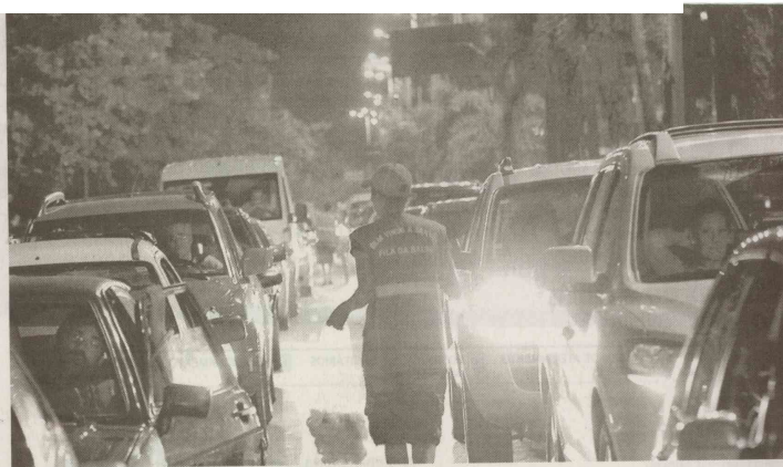
Na noite de ontem, o tempo de espera para a travessia era maior do lado de Santos: 1 hora e 10 minutos

O movimento nas balsas que fazem a travessia Santos-Guarujá também foi intensa desde a tarde de ontem. Por volta das 20 horas, o tempo de espera para os motoristas que esta-