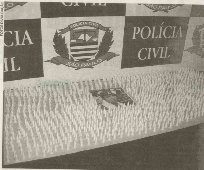
Polícia acredita que a cocaína seria vendida no Cachoeira e na Vila Zilda durante o feriado de Carnaval